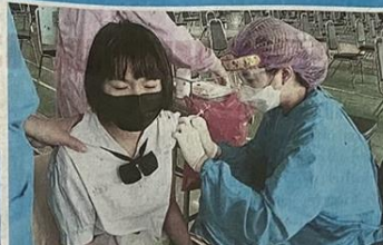
ฉีดเข็มแรก นักเรียนมัธยม ร.ร. วัดประจวบธรรม อ.หันคา จ.ชัยนาท ที่ใจที่ฉีดวัคซีนป้องกันโควิด-19 รับเปิดภาคเรียนใหม่ ที่ศูนย์เทศบาลองค์การบริหารส่วน อ.หันคา มี นายบุญธรรม มีผิว นอ.อ.ว.ให้กำลังใจ