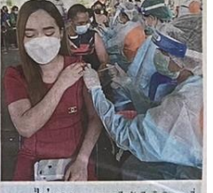
ไม่มอง บรรดาภาคีฉีดวัคซีนโควิด-19 ที่ศูนย์บริการสาธารณสุข ๑๗ ทวีวัฒนา ตึกกม.มิตรไทย และแรงงานต่างด้าวใช้บริการจำนวนมาก