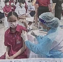
ไม่กลัว นักเรียนจากโรงเรียนใหม่ที่เทศบาลนครวิเศษ อ.ปรางค์มี ใจกล้าเข็มฉีดวัคซีนเข็มที่ 2 ที่ทางเทศบาลให้