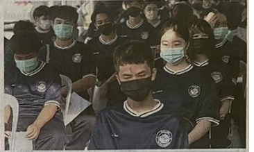
รอฉีดวัคซีน เด็กนักเรียนมัธยมศึกษาใน อ.เมืองนครปฐม 15 โรงเรียน รวม 2,037 คน มีรอรับการฉีดวัคซีนป้องกันโควิด-19 ด้วยความเป็นระเบียบ ที่อาคารสิริวิบูลย์ มท.นครปฐม